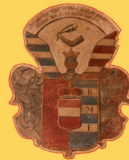
▲ Renesanční křídlo. Erb Czerninů z Chudenic v interiéru zámku. ▼ Hlavní zámecká budova.

Městys Chudenice se snaží zámek postupně rekonstruovat a co největší část zpřístupnit veřejnosti. V rámci projektu s názvem „Rozšíření expozic a výstavba sociálního zázemí Starého zámku v Chudenicích“, jehož realizaci finančně podpořil ROP NUTS II Jihozápad, městys v roce 2014 rozšířením stávajících expozic zprovoznil nový prohlídkový okruh a vybudoval potřebné sociální zázemí pro návštěvníky. Na nádvoří byl obnoven dřevěný přístřešek pro nové venkovní expozice zemědělské a hasičské techniky. Díky tomu vznikla kvalitnější infrastruktura pro návštěvníky a došlo k celkovému posílení konkurenceschopnosti této památky, obce i celého Chudenicika.