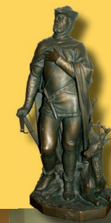
▲ Zámecký pokoj. Kuchyně. ▼ Soška sv. Huberta. Lovecký salonek s trofeje-mi z chudenicckých lesů.