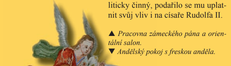
▲ Pracovna zámeckého pána a orientální salon. ▼ Andělský pokoj s freskou anděla.

První zmínka o Czerninech, jakožto jednom z nejstarších českých šlechtických rodů, pochází z roku 1192, kdy byl jmenován Czernin komořím českého krále Přemysla Otakara I. Zmínky o panském sídle v Chudenicích jsou však velmi pozdní a máme je až z roku 1564, kdy se czerninský majetek dělil mezi dva bratry, Humprechta a Jana. Humprecht, jakožto starší z bratří, získal nejen Chudenice, ale také starou otcovskou gotickou tvrz, která stávala na místě dnešního zámku. Protože byl dobrým hospodářem, podařilo se mu postupně chudeniccké panství rozšiřovat a tvrz přestavět na zámeček. Humprecht Czernin kromě mnoha dalších funkcí u dvora zastával též úřad purkrabího (správce) Pražského hradu. A protože byl Humprecht politicky činný, podařilo se mu uplatnit svůj vliv i na císaře Rudolfa II.